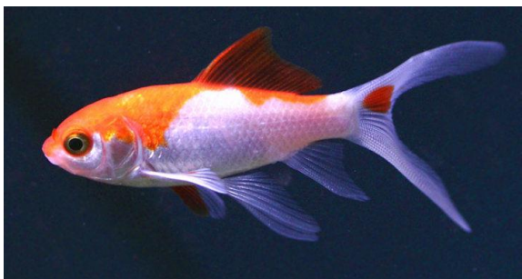
Złota rybka -welon